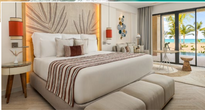
Hab. Junior Suite Ocean View – Dreams Playa Esmeralda